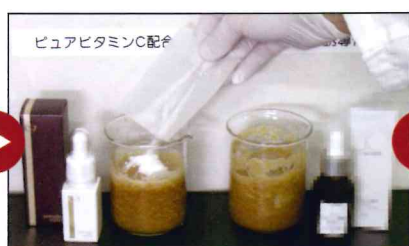
次にC-7の美白成分「ピュアビタミンC」を添加し、混ぜます。