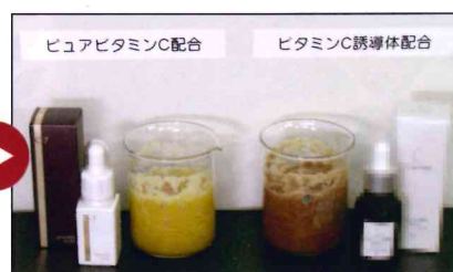
結果、C-7の美白成分の方が他社の美白成分より即効性があり効果が高いことが確認できました。