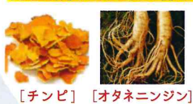
[チンピ] [オタネニンジン]

毛根に栄養分を運ぶために重要なのが血液であり、血行の良さが関わってきます。アメリオール薬用スカルプシャンプーには髪の毛を生成する成分が毛根にきちんと届くよう、血行を促す成分がたっぷり含まれており、頭皮を柔らかくして